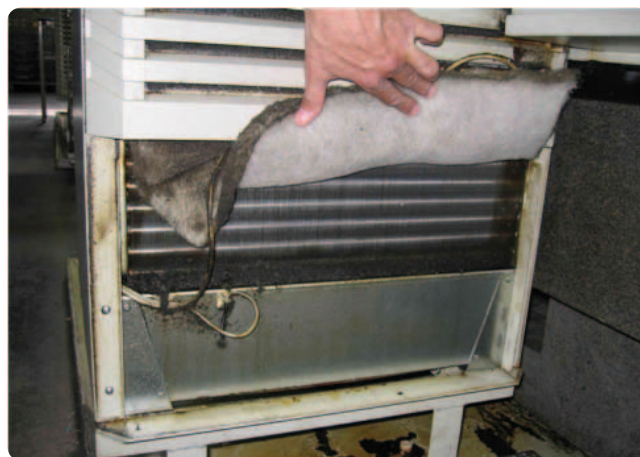
Obr.: Olejové prostredie je mimoriadne komplikované z hľadiska chladenia.

Nad každým strojom je síce umiestnený odsávač olejových pár, ale časť týchto exhalátov predsa len putuje do prostredia.