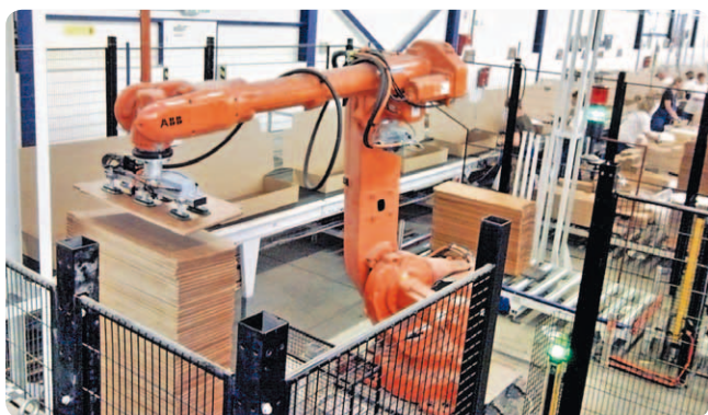
Obr. 4.: Nakladanie výrobkov z palety do kartónov na baliacom páse

Pri tejto aplikácii sa znovu potvrdila efektívnosť využitia softvéru ABB PickMaster 3 a kamerového systému (viac informácií o systéme nájdete na www.abb.sk v sekcii robotika/softvérové produkty).