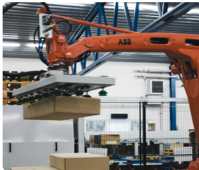
Obr. 5.: Ukladanie naplnených škatúl na palety

Paletizačná bunka pracuje veľmi jednoduchým spôsobom. Robot odoberá obaly z odberného dopravníka z baliacej linky a ukladá ich na určené miesto, ktorým je v mnohých prípadoch drevená paleta. Paletizáciu možno rozšíriť o odoberanie napríklad niekoľkých škatúl nastohovaných na sebe alebo umiestnených vedľa seba. Ďalej možno ukladať balíky v rôznych paletizačných schémach.