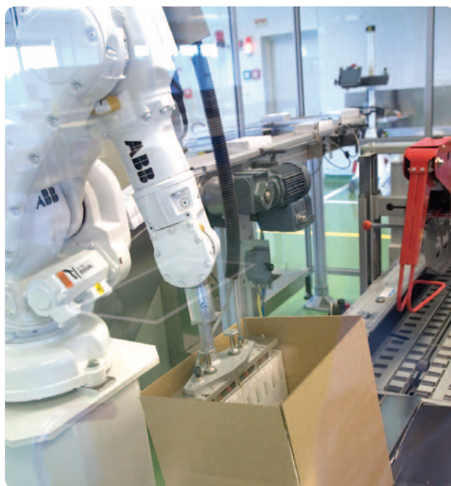
Obr. 3.: Vkladanie malých škatuliek do finálnej veľkej škatule

Ako príklad opíšeme jednoduchú robotickú aplikáciu – vkladanie malých škatuliek do väčšej. Jednoduchý mechanizmus vyrovnáva výrobky na výrobnom alebo baliacom páse a pripravuje ich na odber. Robot ich odoberie a vloží do škatule, ktorá je pripravená v presnej polohe na druhom páse.