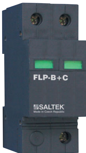
Obr.2 Kombinovaný zvodič bleskových prúdov a prepätia FLP-B+C v pevnom zhotovení

Pri zvedenom prúde 15 kA/pól je to dokonca len 1,7 V. Preto pri osadení tejto ochrany do hlavného rozvádzača v RD stačí doplniť tretí stupeň ochrany k citlivým spotrebičom, ako sú televízory a počítače. Na obrázku je znázornený ekonomický variant ochrany RD. Tri zvodiče Saltek FLP-B+C VE plnia funkciu prvého a druhého stupňa. Sada zaberá len 6 modulových pozícií. Ušetrí sa pri tom nemalá čiastka za oddeľovacie tlmivky, za zvodiče druhého stupňa a približne 9 pozícií v rozvádzači.