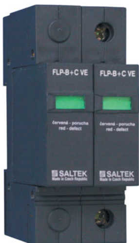
Obr.1 Kombinovaný zvodič bleskových prúdov a prepätia FLP-B+C VE s výmennými modulmi

Kombinovaný zvodič bleskových prúdov a prepätia Saltek FLP-B+C VE (obr. 1) zvádza bleskové prúdy, preto spĺňa podmienky kladené na zvodiče triedy B (VDE 0675-6) a zároveň spĺňa podmienky obmedzenia prepätia pre triedu C – druhý stupeň ochrany. Toto prepätie nemá na výstupe z podružných rozvádzačov prekročiť 2,5 kV. FLP-B+C VE a pri zvedení maximálneho prúdu (viac ako 100 kA/pól) obmedzuje prepätie na hodnotu nižšiu ako 2 kV.