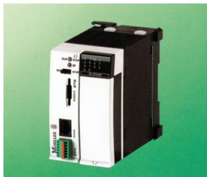
Programovateľný automat XC100

Sortiment najnižšieho radu modulárnych PLC Xcontrol je veľmi dobre vybavený všetkým, čo môžete potrebovať – od pamäťovej karty až po integrovanú priemyselnú zbernicu. Interface CANopen umožňuje systému priame pripojenie na štandardnú zbernicu CANopen s prenosovou rýchlosťou až do 500 kBaud. Základný modul s 8 digitálnymi vstupmi a 6 digitálnymi výstupmi môže byť rozšírený až o 15 I/O modulov pod označením XIOC.