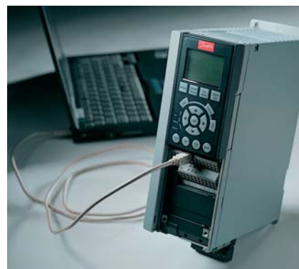
Obr.4 USB port