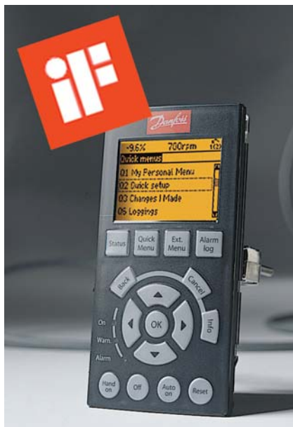
Obr.3 Viacjazyčný grafický ovládací panel