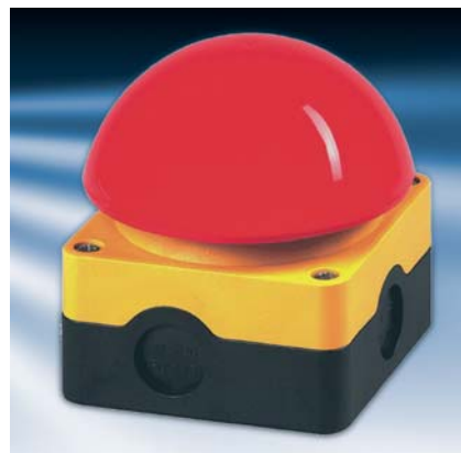
Obr.5 Funkcia bezpečného vypnutia

Meniče VLT Automation Drive môžu byť diaľkovo ovládané a monitorované za použitia kábla USB (Universal Serial Bus) alebo používateľského rozhrania FieldBus