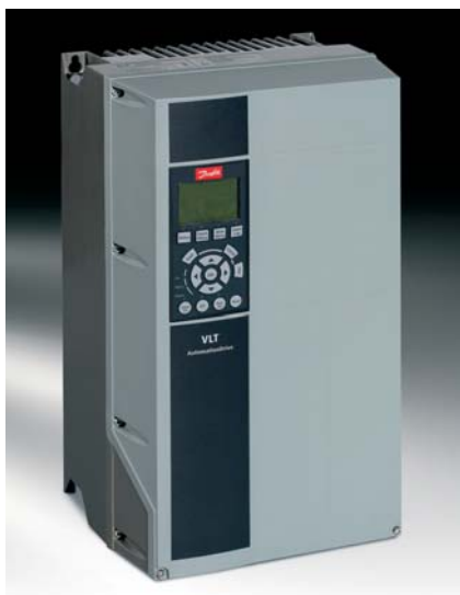
Obr.1 Frekvenčný menič FC 301

Nový rad VLT Automation Drive FC301 spolu s VLT Automation Drive FC302 pokrýva celé výkonové spektrum. Frekvenčný menič FC 301 (obr. 1) je skonštruovaný na rovnakom technologickom základe ako menič FC 302 (bol uvedený na trh ako prvý) – je rovnako flexibilný, spoľahlivý a ľahko ovládateľný. Menič FC 301 má s meničom FC 302 mnoho spoločných funkcií a bol vyvinutý ako lacnejšie