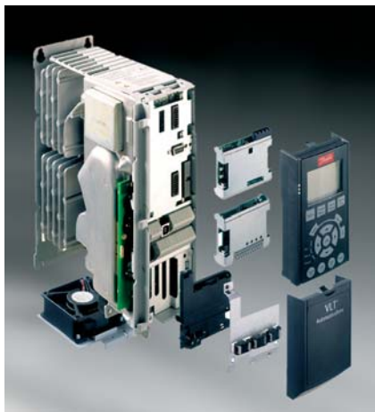
Obr.2 Modulárna koncepcia

riešenie pre aplikácie s nižšími požiadavkami.