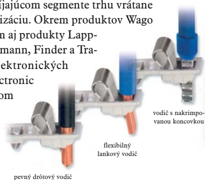
pevný drôtový vodič

Dve techniky sa spojili do optimálneho riešenia: WAGO TOPJOB®S – svorkovnica s CAGE CLAMP®S spojkou