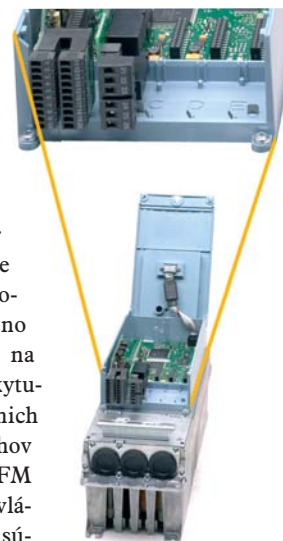
Obr.2 Rozšíriteľné komunikačné karty pre VACON NX