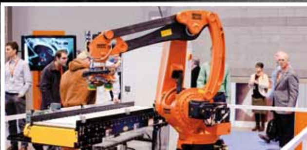
Na podujatí sa zúčastnilo viac ako 200 systémových integrátorov a partnerov Rockwell Automation.