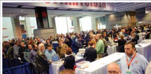
Od skorého rána prichádzali na Automation Fair odborníci z oblasti automatizácie. Návštevnosť nakoniec prekročila hranicu 12 000.