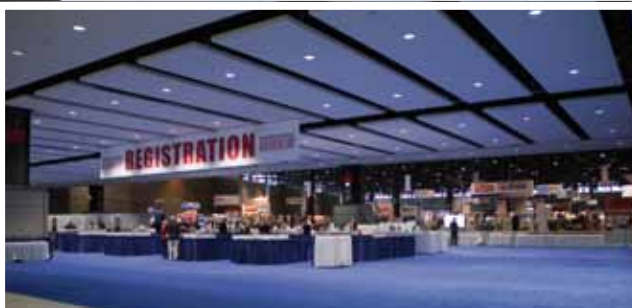
20. ročník Rockwell Automation Fair 2011 otvára svoje brány.