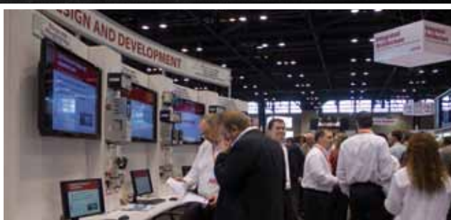
Čulý ruch na Automation Fair 2011.