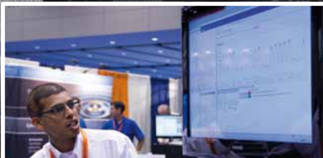
Softvérový inžinier a FactoryTalk.