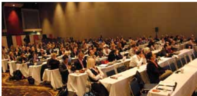
Podujatia „Manufacturing Perspectives“, ktoré sa uskutočnilo ešte pred oficiálnym začiatkom Automation Fair, sa zúčastnilo viac ako 150 novinárov z celého sveta.

V polovici novembra sa v Chicagu uskutočnilo najväčšie automatizérske podujatie svojho druhu na západnej hemisfére – Rockwell Automation Fair. Jubilejného 20. ročníka sa zúčastnil aj ATP Journal. Počas troch dní si mohli návštevníci vypočuť prednášky významných osobností na Manufacturing Perspectives, vyskúšať produkty Rockwell Automation a jeho partnerov na veľtrhu alebo sa zúčastniť diskusných fór. Viac informácií o podujatí prinesieme v nasledujúcom čísle.