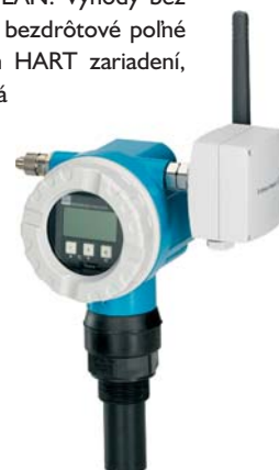
WirelessHART Adapter na rýchle pripojenie existujúceho HART zariadenia do bezdrôtovej siete WirelessHART

Výhodou Mesh siete je jej schopnosť samoorganizácie a samoopravy, čo v praxi znamená, že každá komunikujúca jednotka "stráží" svoje najbližšie susedné jednotky, vytvára s nimi optimálne, resp. najkratšie prenosové cesty, sleduje silu signálu, získava informácie o synchronizácii a podobne. V prípade výpadku najkratšej prenosovej cesty dokáže Mesh sieť vytvoriť alternatívne prenosové cesty. Diaľkový zber dát a komunikáciu s nadradeným systémom na platforme HART OPC Server, ethernet alebo Modbus zabezpečí WirelessHART Fieldgate. Pólné zariadenia sú vybavené vysielačom WirelessHART Adapter. Ten možno využiť aj na rýchle pripojenie existujúceho HART zariadenia do bezdrôtovej siete WirelessHART.