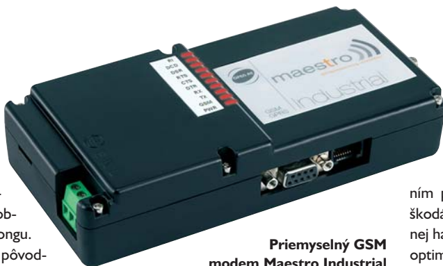
Priemyselný GSM modem Maestro Industrial

Novinkou v sortimente je Maestro Heritage, zostava GSM modemu so zásuvným modulom na spojenie s okolím. V súčasnosti je k dispozícii modul 6x digitálny vstup + 6x digitálny výstup. Maestro