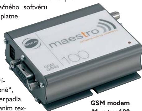
GSM modem Maestro 100

ku každému modemu Maestro Heritage. Softvér umožňuje pomenovať každý vstup či výstup. Zaplavenie stráženého priestoru sa potom môže prejaviť príjmom správy „zaplavené“, dialkové zapnutie čerpadla možno realizovať odoslaním textovej správy „čerpaj!“. Nastaviť možno i posielanie alarmových SMS v prípade splnenia alarmových podmienok (aktivácia/deaktivácia zvolených vstupov). K dispozícii je i systém prístupových práv ku každému telefónu (SIM), ktorý môže prostredníctvom SMS s modемом komunikovať. Možno využiť i ďalšie služby, napríklad preposielanie správ od operátora (o stave kreditu atď.). Akékoľvek ďalšie technické alebo obchodné informácie o výrobkoch Maestro Wireless si vyžiadajte v ľubovľhovej kancelárii spoločnosti FCC Průmyslové systémy.