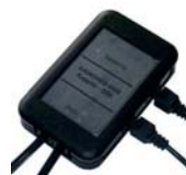
STK – coupler

v maximálne 12 reťazoch. Batériový modul obsahuje LED signalizáciu alarmu a stavov. Použitie tohto produktu výrazne znižuje náklady na servis a údržbu systému a vopred upozorňuje na možné vzniknutie kritického stavu v batériových blokoch.