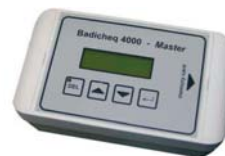
Badicheq4000 – Master

Advanced Power System GmbH & Co. KG (AdPoS) vyrába: