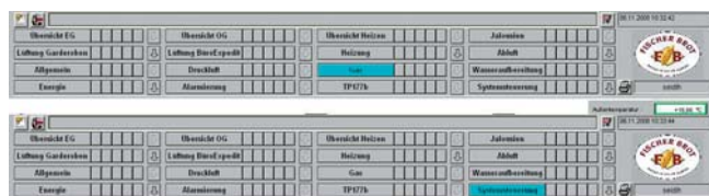
System - Übersicht (Netzstruktur)