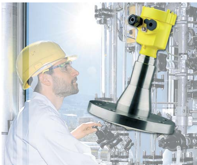
Obr.1 Radarový hladinoměr Vegapuls 63

Dosažení potřebné úrovně bezpečnosti a spolehlivosti je zajištěno mimo jiné možností volby verzí pouzdra od plastového, přes hliníkové až po elektrolyticky leštěné pouzdro z korozivzdorné oceli. Stupeň krytí je IP66, IP68 nebo až IP69K. Veškeré snímače jsou k dispozici v jiskrově bezpečné verzi (Ex ia) nebo v provedení s pevným závěrem (Ex d), a lze je proto použít v prostředí s nebezpečím výbuchu. Snímače je možné čistit a sanitovat procesy CIP a SIP. Typ procesního připojení a těsnicí materiály vyhovují americkým nařízením FDA, 3-A i evropské normě EHEDG. K dispozici je certifikát, že snímače odpovídají podmínkám příslušné úrovně funkční bezpečnosti SIL podle normy EN 61511.