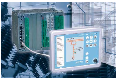
Multifunkčný terminál SPRECON-E-P

Multifunkčný terminál SPRECON-E-P dopĺňa úspešnú rodinu produktov Sprecher automation pre energetiku SPRECON-E®.