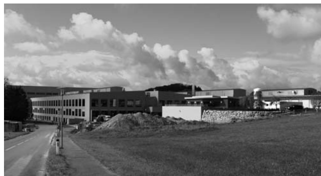
Novopostavené haly v areáli spoločnosti v Eggelsbergu

V ostatnom období pocítovali vo výrobnom závode v Eggelsbergu nedostatok priestoru pri rastúcich objemoch produkcie. Ešte koncom roka 2008 si firma prenajímala 10 000 m 2 , pričom rovnakú plochu využívala z vlastných zdrojov. Rozhodnutie postaviť si vlastné výrobné haly bolo logickým krokom v ďalšom napredovaní. Nové haly sa postavili