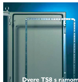
Dvere TS8 s rámom

Vo vývoji skrií však platí pravidlo: „Nemeň, čo je výborné a overené.“ Práve preto mnohé detaily skrine ostali podobné alebo totožné, ako boli pri „starých“ skriniach – to sa týka napríklad rámu dverí, montážnej dosky alebo aj niektorých profilov rámu.