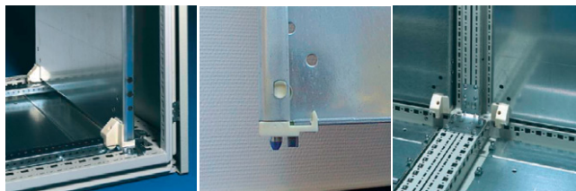
Montážna doska TS8

To, čo umožňovalo vylepšenie, bolo vylepšené, napríklad zatváranie dverí – teda jednak navýšenie na štvorbodové namiesto trojbodového uzatvárania. Táto zmena umožnila dosiahnuť celkový stupeň krytia IP55 pri všetkých rozmeroch skrií. Ďalej prepracovanie uzamykacej kľučky – teda otváranie namiesto otočením len prostým vyklopením kľučky umožnilo zase využiť plochu dverí na vstavenie aj väčších prístrojov, napríklad klimatizačných jednotiek.