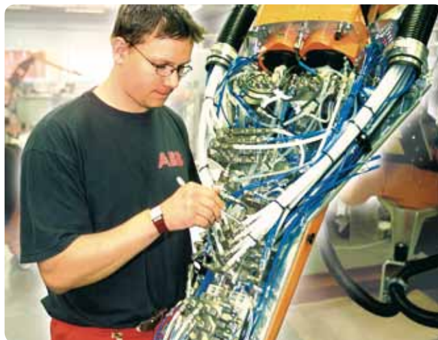
ABB Robotics Service chce byť jedným z hlavných dôvodov, prečo zákazníci a partneri budú naďalej kupovať roboty ABB. Poskytujeme svetovú triedu kvality servisu, kdekoľvek sú roboty a systémy so značkou ABB nainštalované.